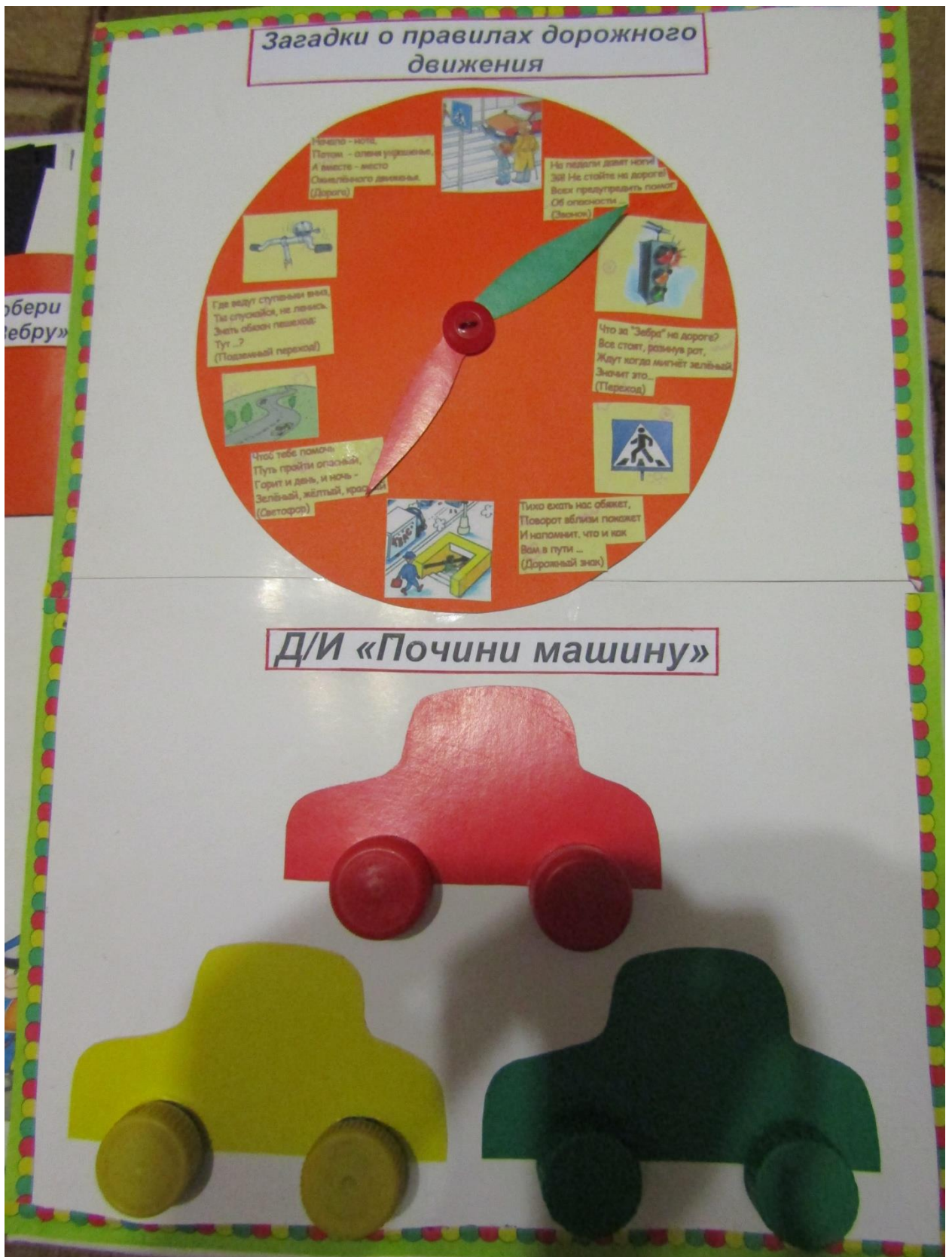
13. «Загадки о транспорте и ПДД».

Содержание: ребенок ставит красную стрелку на загадку, воспитатель ее зачитывает, и ребенок зеленой стрелкой выбирает ответ.