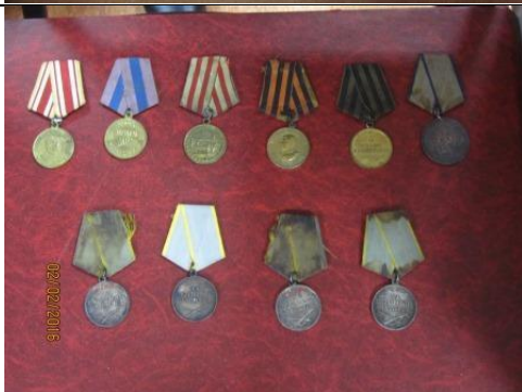
Боевые награды марьевцев-фронтовиков