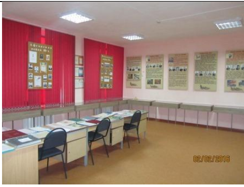
Южная и Западная стены.

На Южной стене находятся стенды: «Афганская война 80-х» и «Чеченская война 90-х». На них представлены фотографии, копии наградных материалов марьевцев – участников афганских и чеченских событий. На Западной стене – стенды, отражающие основные этапы ВОВ с фотографиями марьевцев –участников крупнейших битв войны. На столах по центру –альбомы, проекты, книги, газетные статьи.